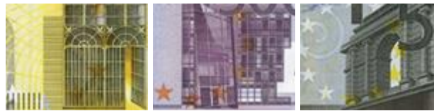
Fenster und Türen auf den Eurobanknoten