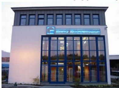
© Enno Roggemann GmbH & Co. KG

Visit of Enno Roggemann GmbH & Co. KG 16348 Wandlitz (Wholesale Timber)