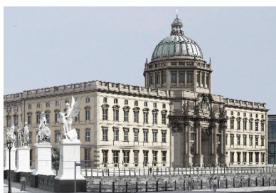
© SHF / Architekt: Franco Stella mit FS HUF PG

Besuch mit Führung im Berliner Schloss Besichtigung des weit fortgeschrittenen Wiederaufbaus des Berliner Schlosses in der historischen Mitte Berlins mit seinen barocken Stadtfassaden und einer moderne Ostfassade zur Spree hin.