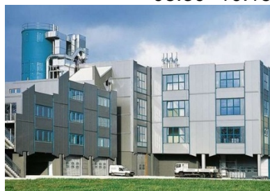
© Hans Timm Fensterbau GmbH &amp; Co. KG

Besuch der Hans Timm Fensterbau GmbH & Co. KG 12277 Berlin